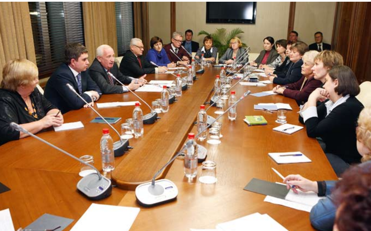
На встрече губернатора с представителями общественных благотворительных организаций Томской области